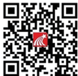
移动图书馆二维码