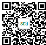
南理工学生事务微平台

南京理工大学本科生管理相关规定详见《南京理工大学学生手册》，手册于开学后发放，学校将组织学习和测试，电子版将于2021年10月在南京理工大学学生工作处网站 ( http://xgc.njust.edu.cn ) 和官方微信公众号 (i_NUST, 南理工学生事务微平台) 公布，敬请关注！