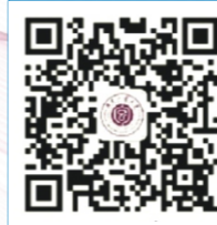
湖南工业大学官方微信平台