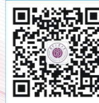
湖南工业大学招生就业云服务平台