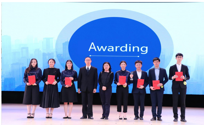
商英学院学子获全国商务英语实践大赛总冠军

2023 届毕业生共 420 人，其中男生 82 人，女生 338 人。 学院较早在所有专业推行全英教学模式，注重学生跨文化交际能力、实践能力、创新能力、就业创业能力和自主学习能力的“五种能力”的培养，把知识传授与能力培养融为一体。毕业生主要去向为省市级国家机关、世界 500 强企业、四大国有银行、四大会计师事务所、外经贸单位、三资企业等，呈现“就业率高、就业层次高、就业满意度高、就业薪酬高”的四高态势。