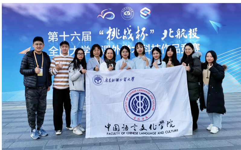
图 3: 我院学生在第十六届“挑战杯”全国大学生课外学术科技作品竞赛获二等奖