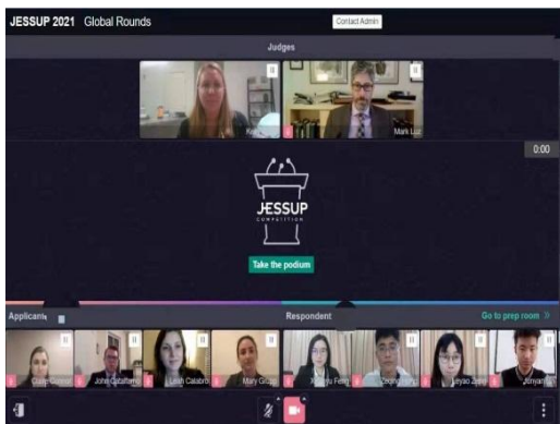
我院代表队对阵美国乔治华盛顿大学