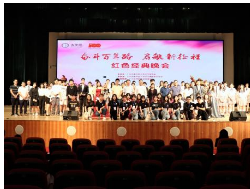
法学院 2021 年红色经典晚会