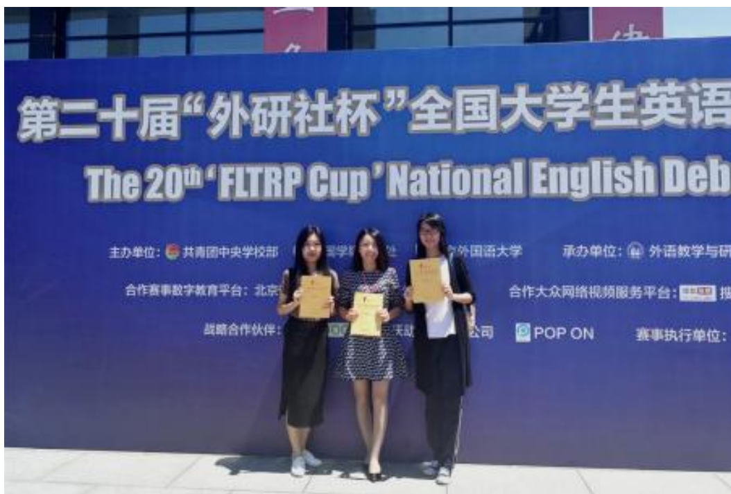
商英学院研究生获第二十届“外研社杯”全国大学生英语辩论赛一等奖

毕业生就业范围广泛，毕业生分布在跨国公司、大型国内企业、政府外事外经部门、外交部、商务部等单位，毕业生受到用人单位的一致好评。