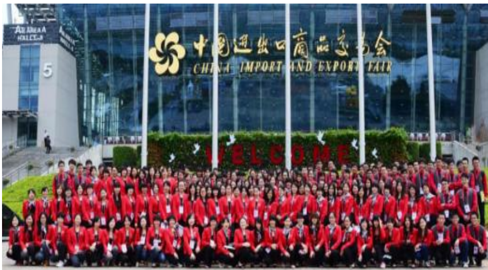
商英学院学生参加中国进出口商品交易会（广交会）实习

课程设置： （1）商务英语课程：综合商务英语、法律英语、商务英语写作、商务英语听说、商务沟通、英语口语译/笔译、法律口译/翻译、高级英语阅读与写作、英语国家社会与文化、英美文学、跨文化商务交际等。（2）方向课程：民法、商法、民事诉讼法、国际经济法、WTO 导论、涉外法律实践、当代商业概论、基础会计、国际贸易实务、ERP等。