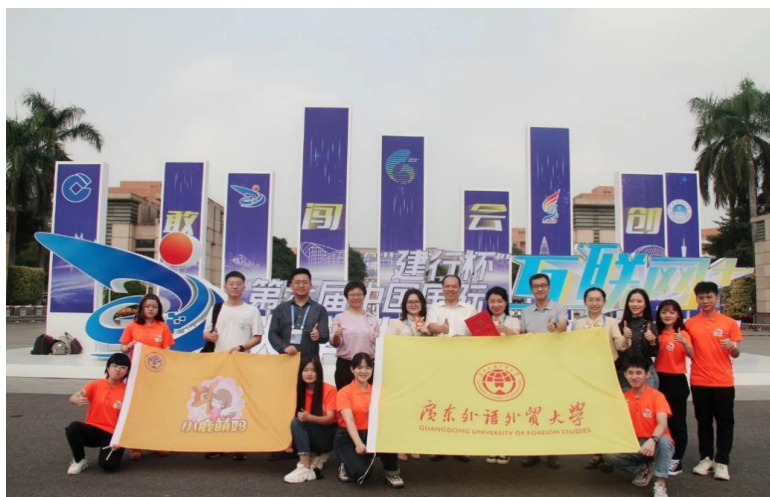
图 2: 2020 年我院“小鹿萌妈”创业团队荣获全国“互联网+”创新创业大赛全国金奖及“挑战杯”中国大学生创业计划竞赛金奖

2023 届毕业生共有 35 人，其中男生 8 人，女生 27 人。 毕业生的就业去向主要是在文化产业、媒体、政府管理部门、企事业单位，从事文化艺术管理、文化经营、文化市场运作、文化项目策划、文化经纪、贸易、咨询和国际文化交流与传播工作。