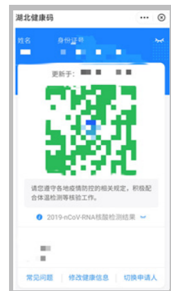
湖北健康码页面截图