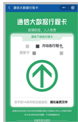
国务院客户端的防疫行程卡

将相关资料以 zip 格式压缩打包,邮件统一命名为“用人单位名称—某月某日宣讲会/双选会”,发送至邮箱 gcxyzj@163.com ,由就业指导中心向保卫处报备进校人员信息。企业人员关注湖工大保卫处 HBUT 公众号,注册个人信息之后,在授权时间内扫描校园码,测量体温进入校园。