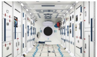
承担载人航天空间站实验舱工效学设计任务