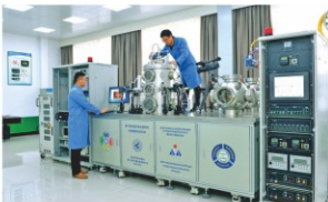
空间材料科学与技术重点实验室

级教学名师5人,国家级团队28个,国家级青年人才99人,设有21个博士后流动站。