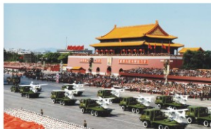
在建国60周年国庆阅兵中首次亮相的无人机方队全部3个型号均由我校研制生产