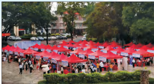
▲ 2022届毕业生就业促进周“百日冲刺”春季校园招聘会

就业方向： 本专业毕业生主要在金融机构（银行、证券、基金等）、公共事业单位、党政机关、城市建设与管理部、房地产行业（万科、保利、碧桂园等）以及世界 500 强企业从事项目、行政、资金等管理工作。